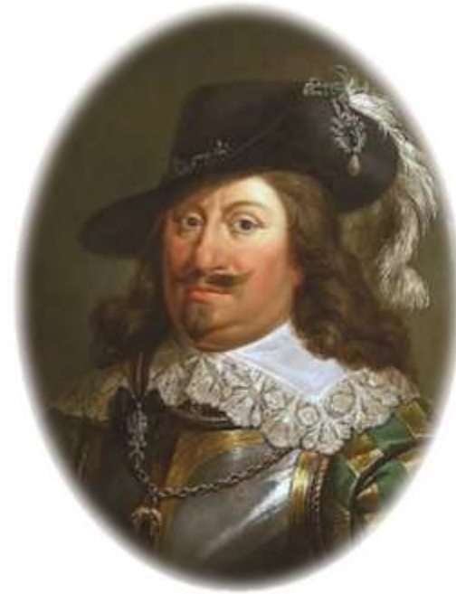
Король Польши Владислав IV Ваза