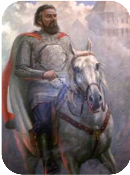
Боярин Шейн Михаил Борисович