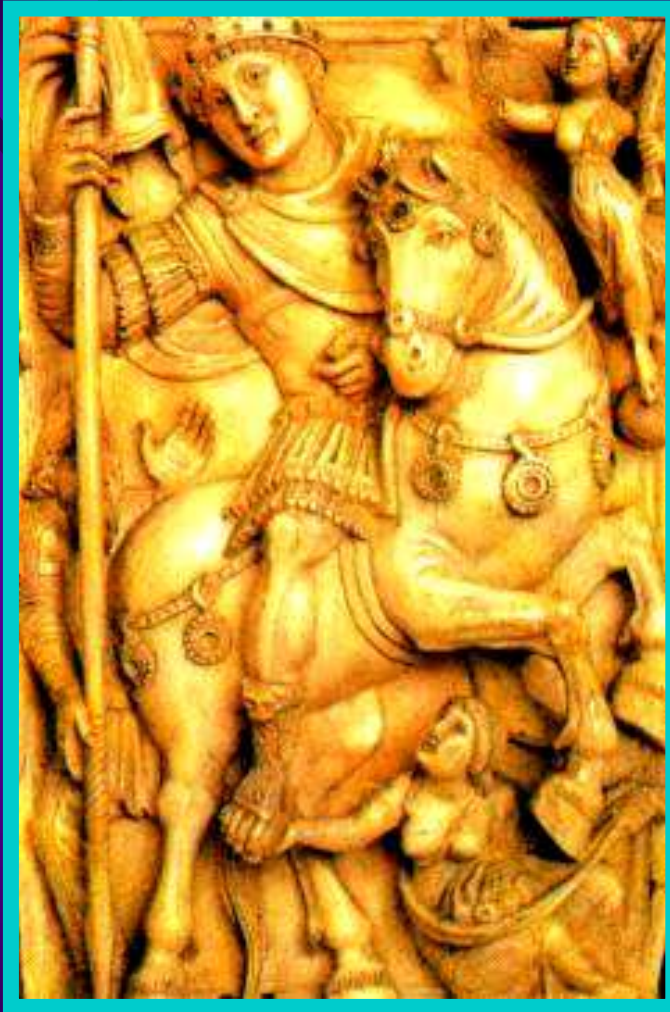
Император-воин. Барельеф 6 в.