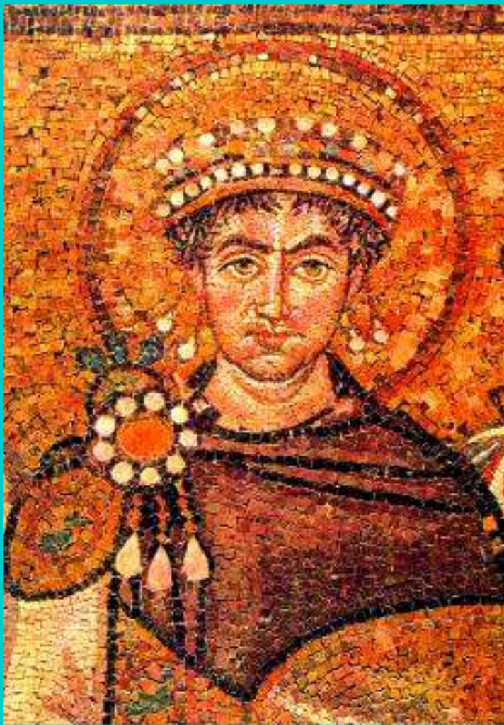
Император Юстиниан. Мозаика церкви Сан-Витале в Равенне.6 в.