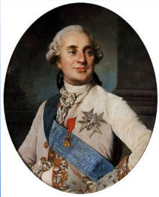
Людовик XVI (1754 – 1793)

Из дневника Людовика XVI накануне революции во Франции: