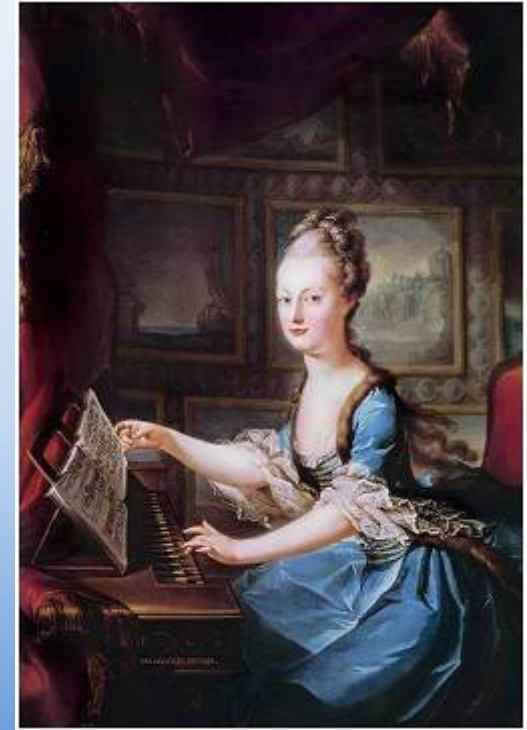
Мария-Антуанетта (1755 – 1793)

«Июнь. 20-е – охота на оленя в 9 часов в Бютар, застрелил одного. 22-е – ничего. 25-е – ничего, охота на оленя в Сент-Аполлин. 30-е – ничего».