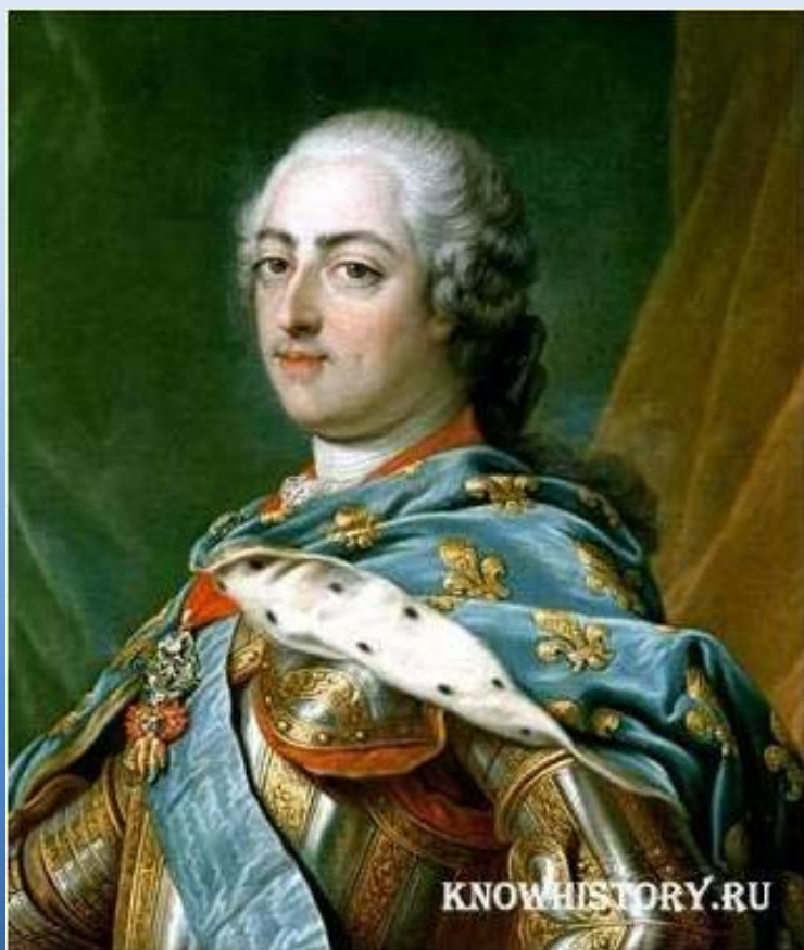
Людовик XV (1715 – 1774)

«Только в одной моей особе пребывает королевская власть. Весь общественный порядок во всем его объеме исходит от меня, интересы и права нации – все здесь, в моей руке.